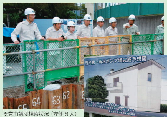
※党市議団視察状況(左側6人)

鹿児島市では、現在、低地区総合浸水対策緊急事業(9地区)が行われています。同事業の進捗状況を調査するため、党市議団6名全員で工事現場(鴨池第一雨水ポンプ場)を視察しました。本市では2004年8月、9月、05年9月の3回、大潮と台風が重なり、市街地で甚大な浸水禍を引き起こしてきたことから、低地区の浸水対策について、党市議団として、議会質問や予算要望などを通して「緊急かつ抜本的な対策」を要望し続けていたものです。